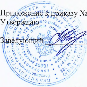
График получения кипяченой воды на пищеблоке