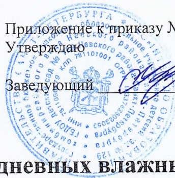
График проведения ежедневных влажных уборок физкультурно-музыкального зала с обработкой всех контактных поверхностей с применением дезинфекционных средств, применяемых для обеззараживания объектов при вирусных инфекциях, в соответствии с инструкцией по их применению.